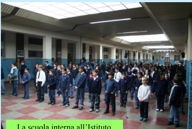
La scuola interna all'Istituto