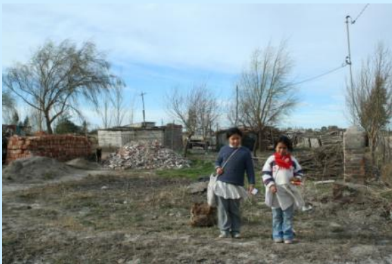
La realtà esterna all'Istituto con le case isolate